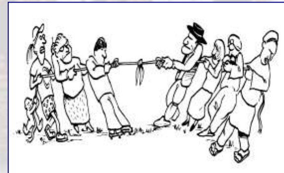
អត្ថប្រយោជន៍រួមគ្នា

ដូចដែលការពហុភាគីដ៏ទៃទៀតផងដែរ សំហាត់ការងារស្តីពីការបង្កើនប្រសិទ្ធភាពនៃភាពជាដៃគូ ឆ្នាំ២០០៩-២០១០ បានគូសបញ្ជាក់ថា អភិក្រមគ្រប់គ្រងទូទាំងកម្មវិធីទាមទារសមត្ថភាពដែលពុំមែនត្រឹមតែបច្ចេកទេសនោះឡើយ ហើយកម្រិតនៃការទុកចិត្ត ការគោរពគ្នាទៅវិញទៅមក និងការចែករំលែករបៀបវារៈរួមមួយ